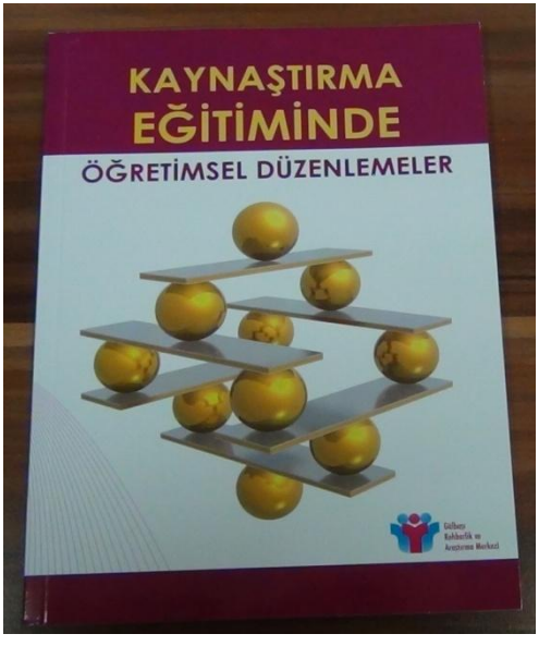
Instructional Arrangements In Mainstreaming Education