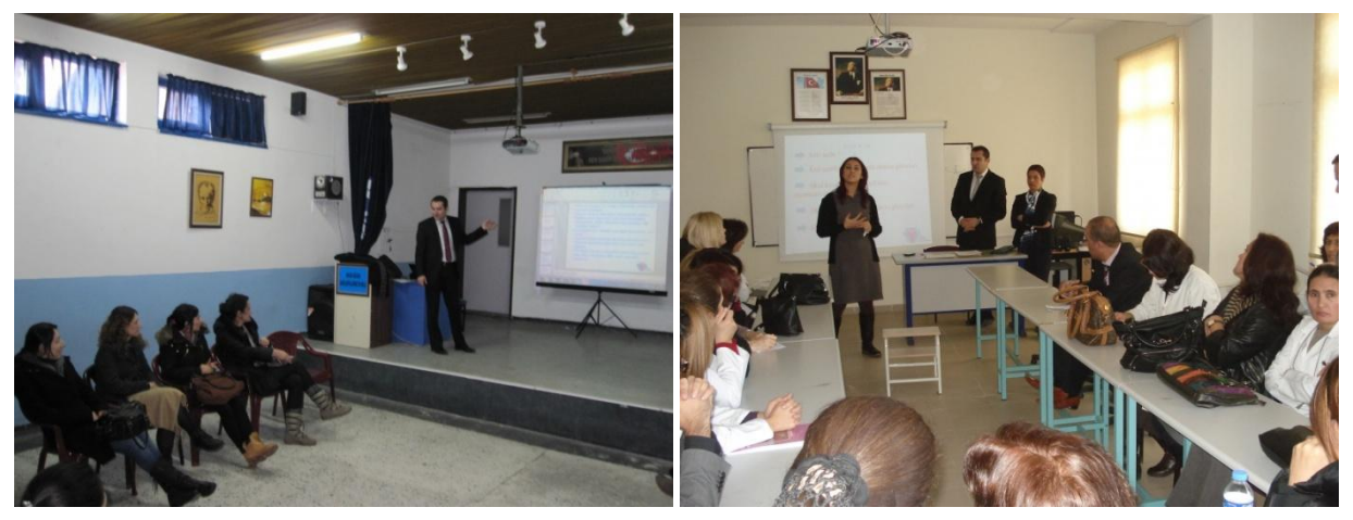
Educational Seminary for Parents

Training Workshop for Intervention to Crisis Situations